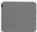
HP 100 -desinfiointiva hiirimatto 8X594AA