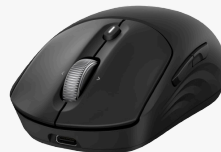
HP 700 -ladattava langaton hiiri AZ7B0AA