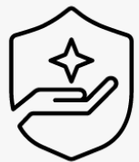
Nouto ja palautus -takuu kolme vuotta UM963E