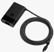
HP USB-C 65W Laptop Charger 671R2AA