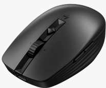
HP 710 Rechargeable Silent Mouse 6E6F2AA