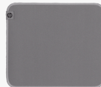
HP 100 -desinfioitava hiirimatto 8X594AA